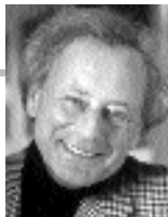
Professor Dr. Reinhold Würth, Beiratsvorsitzender der Würth-Gruppe