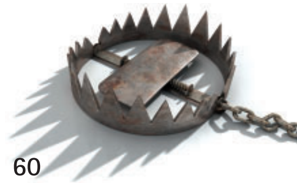
CDS sollen vor Kreditausfällen schützen. Besitzen Gläubiger aber zu viele, könnte dies das Insolvenzrisiko erhöhen.

Die These vom effizienten Markt ist Makulatur. Wir brauchen dringend ein neues Portfoliomodell.