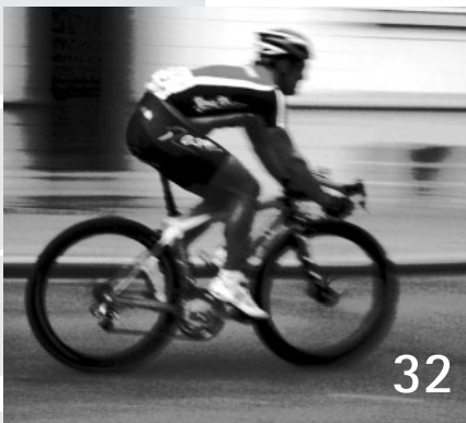
Im Rennen gegen die Zeit entgeht Wirtschaftsprüfern mancher Fehler – gerade jetzt.

Die Solarindustrie stottert. Das ist die große Chance zur Konsolidierung. Wer überlebt und wer das Solargeschäft in der Zukunft dominieren wird.