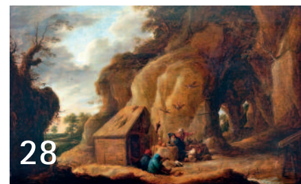
Opportunisten, die das Financial Engineering ausgereizt haben bis zum Gehtnichtmehr, haben jetzt ein Problem.