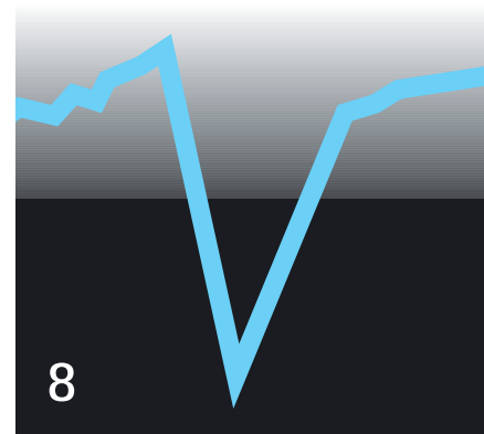
Was, wenn wir wirklich ein „V“ bekämen? Unternehmen müssten dann zittern. Nie ist das Insolvenzrisiko größer.