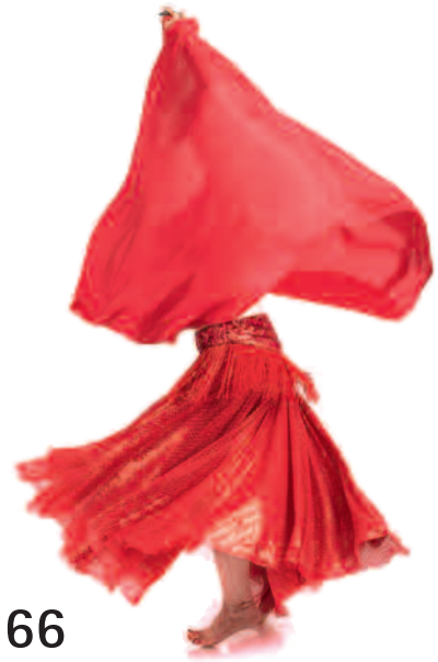
Undurchschaubar: Banken können ihre Bilanzen so geschickt verschleiern, dass kaum jemand mehr durchblickt.