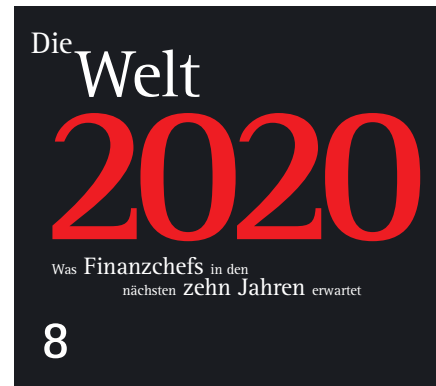
Kredit über Google, Treasury-Dienstleister aus China: Das und viel mehr könnte bis 2020 auf CFOs zukommen.