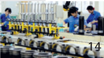
Nicht jeder Maschinenbauer ist in China gut aufgehoben.