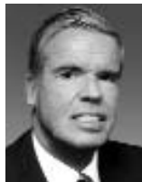
Klaus-Michael Kühne, Präsident des Verwaltungsrates der Kühne & Nagel Gruppe