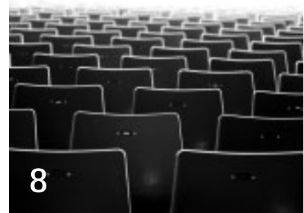
Die neuen Bankenaufgaben werden Finanzabteilungen hart treffen. Doch wo sind die CFOs, die sich einmischen?