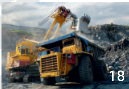
Der Erzpreis wird unplanbar: Die Lieferanten kürzen die Vertragslaufzeiten, und Spekulanten entdecken den Markt.

Unternehmen sollten nicht einfach dem Trend zu globalen Shared-Service-Centern nachlaufen. Das kann innerhalb der Finanzabteilungen schnell nach hinten losgehen.