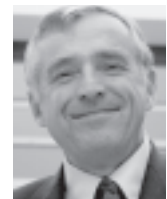
Erich Sixt, Vorstandsvorsitzender der Sixt AG